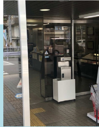
市役所入口 (奈良県)