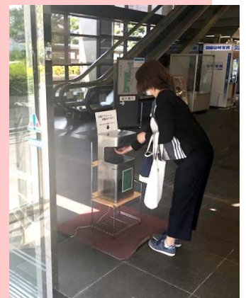
市役所入口 (兵庫県)