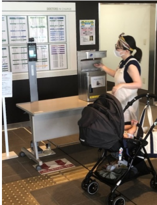
総合病院エントランス (奈良県)