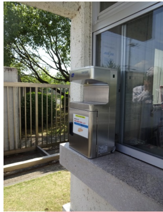
工場守衛室 (京都府)