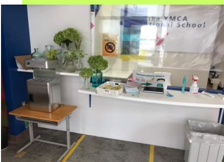
学校玄関受付 (大阪府)