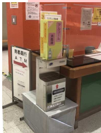
市役所入口 (奈良県)