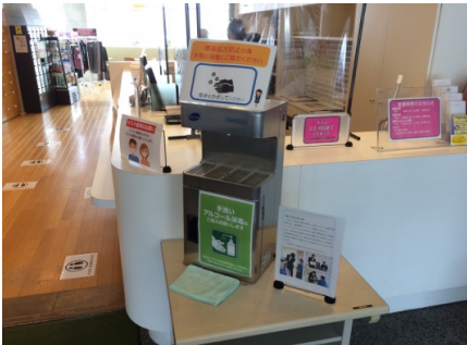
温浴施設入口 (兵庫県)