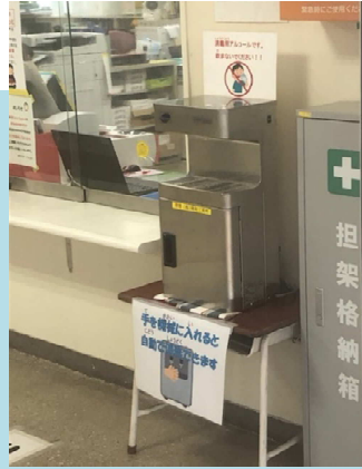
スポーツ施設受付 (兵庫県)